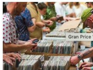
Gran Price Vinyl Fest

Durant tot el cap de setmana hi haurà una programació de DJ's que amenitzaran l'ambient i que participaran en l'activitat estrella de la fira: DJ's vs. Dealers . En aquesta, els DJ's són convidats a venir sense la seva maleta de discos i se'ls hi assigna una parada de la fira per sorteig. En una hora els participants han de preparar-se la sessió amb el que hi puguin trobar, sense