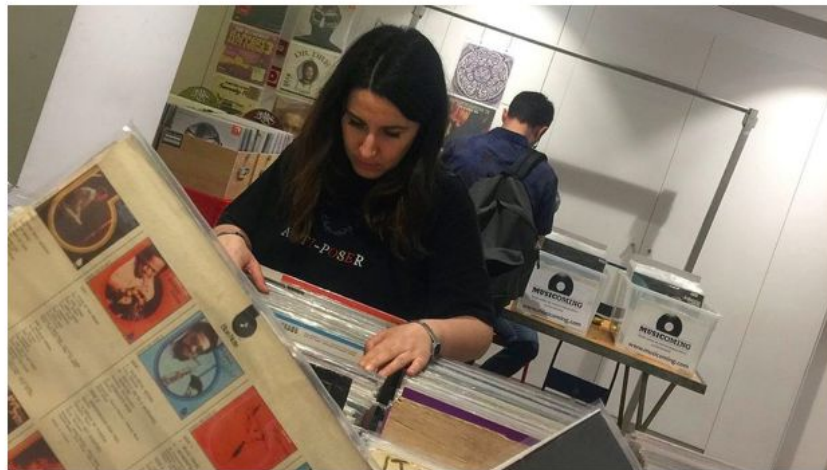
Imagen promocional del Gran Price Vinyl Fest.

Coincidiendo con el Sónar, la feria de discos Gran Price vuelve al Espai Veïnal Calàbria 66. Al gancho del vinilo se suma el de las sesiones 'Dj's vs. Dealers', en las que a cada 'dj' se le asigna un puesto de la feria y solo puede pinchar con material del mismo. Sábado y domingo, de 12.00 a 21.00 horas.